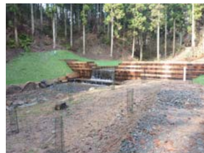
▲森林土木における床固工の設計事例