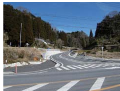
▲道路改良設計の事例